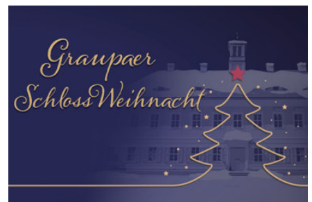
Graupaer SchlossWeihnacht

Bereits zum zehnten Mal findet im und um das Graupaer Jagdschloss ein kleiner, aber feiner Weihnachtsmarkt statt. Hof und Schloss sind festlich geschmückt. Große und kleine Gäste werden von Handwerkern, Gastronomen und Musikanten zum Schauen, Staunen, Hören, Schmecken und Kaufen eingeladen. Für die Jüngsten gibt es unter anderem ein Karussell sowie Angebote zum Basteln, Knüppelkuchenbacken und Alpakas.