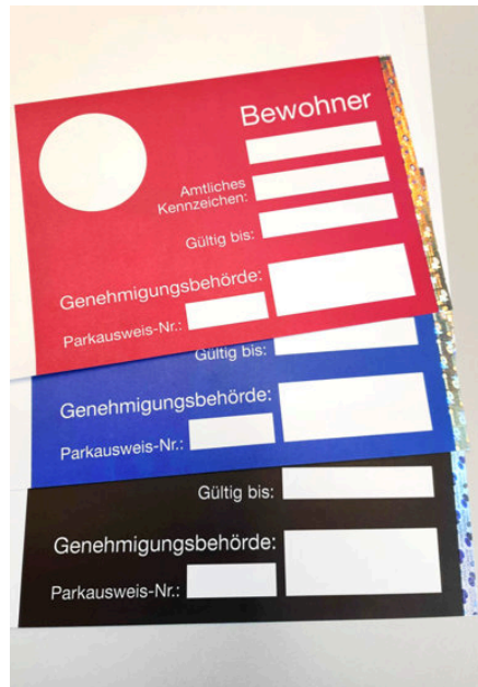
Parkkarten für Anwohner und Beschäftigte sowie für Anliegen mit Ausnahme-genehmigungen

Der Bescheid bzw. die Parkkarten werden bis Ende Dezember zugesendet. Sollte der Versand bis zu diesem Datum nicht erfolgt