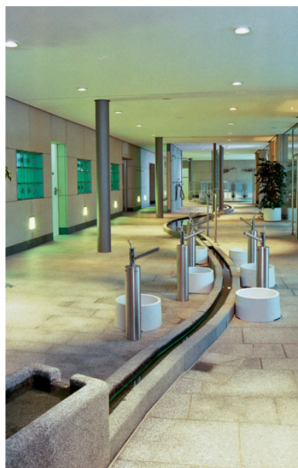
Saunalandschaft im Geibelbad

Am Freitag, dem 6. Dezember ist Nikolaustag. Für die kleinen Besucher des Geibelbades hat der Nikolaus Süßigkeiten dargelegt. Es gibt eine kleine Überraschung. Die „Großen“ sind eingeladen, ab 22:00 Uhr die Stiefel und die Kleidung abzulegen, denn dann ist Nacktbaden im Geibelbad angesagt. Zusätzlich zur regulären Öffnungszeit hat die Sauna an diesem Tag über Mitternacht bis 2:00 Uhr morgens geöffnet. In dieser Zeit wird zusätzlich zum Saunabereich der gesamte Badebereich zur textilfreien Zone. Bis 22:00 Uhr ist normaler Bade- und Saunabetrieb. Es wird der reguläre Eintrittspreis erhoben. (SWP)