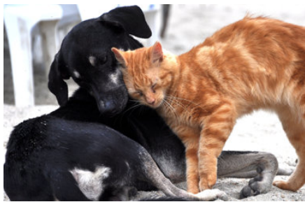
Hund und Katze

Andrea Möbius, Tierschutzverein Pirna u. U.