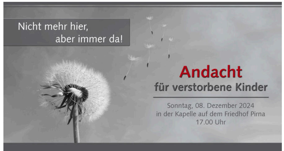
Abbildung: Sternelalterträume Pirna e.V.