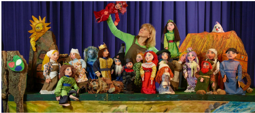
Das Puppentheater Ringelrose in Aktion