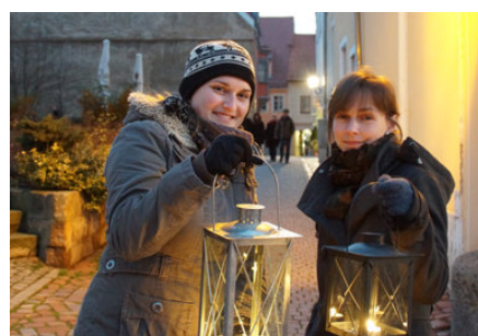
Auf zur Lichtelführung!

Weihnachtsfeiertagen. In den Räumlichkeiten im Canalettohaus gibt es zahlreiche regionale Kleinigkeiten: Ob ein „Probierchen“, handgemachte Seife, Kalender oder Baumschmuck – für jeden Geschmack findet sich das richtige Geschenk. Geschmacklich zu empfehlen sind auch die diversen Heißgetränke, die während des Canalettomarkts in der Pirna-Hütte direkt vor dem Canalettohaus verkauft werden. Der TSP dient auch als Treffpunkt für die Pirnaer Lichtelführungen. Der etwas andere Rundgang durch die weihnachtliche Altstadt findet in der Adventszeit immer freitags und samstags jeweils um 16:00 Uhr statt. Mit kleinen Laternen ausgerüstet, streifen die Teilnehmer durch die romantischen Gassen an geheime Orte und erfahren so manches aus vergangenen Zeiten. Als Besonderheit erwartet die Gäste ein vorweihnachtliches Mitbringsel. Die Führung dauert rund zwei Stunden und kostet 12 Euro pro Person. Reservierungen sind im TSP, per E-Mail touristservice@pirna.de oder telefonisch 03501 556-446 möglich. Zum saisonalen Produktangebot des TSP zählen wiederum die stark nachgefragten Christbaumkugeln in mattem Bordeauxrot mit elegantem Gold-Dekor der Pirnaer Alt-