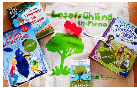
Lesefrühling in der Stadtbibliothek Pirna

Wer möchte, gestaltet zu einem Buch ein Bild, das bis zum 16. Mai in der Schule abgegeben wird. Die eingereichten Bilder werden dann in der Stadtbibliothek Pirna ausgestellt und prämiert.