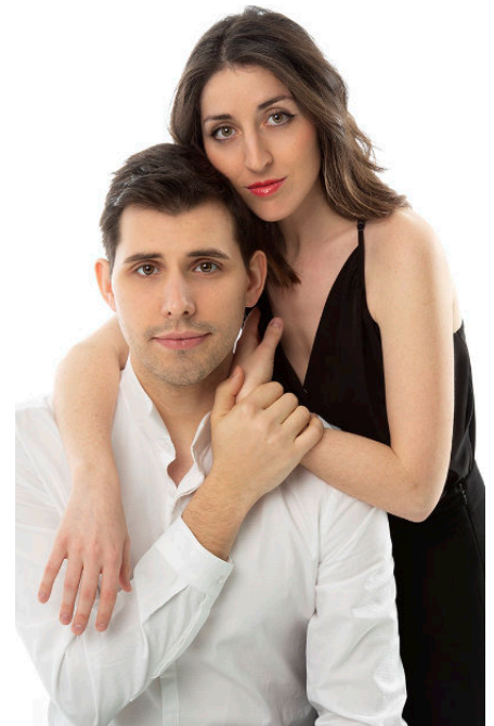
Vierhändig am Klavier: Das Anton und Maite Piano Duo

Mit dem Anton & Maite Piano Duo gastiert am 27. März 2022 eines der bekanntesten spanischen Duos der Gegenwart in den Richard-Wagner-Stätten Graupa. Ihr vierhändiges Klavierspiel kann es mit der Klangvielfalt und Registerbreite eines ganzen Orchesters aufnehmen. Bei diesem Klavierduett arbeiten die 20 Finger der beiden als Team zusammen, um das Potenzial des Klaviers voll auszuschöpfen und ein Maximum an Übereinstimmung zu erzielen. Das Anton & Maite Piano Duo präsentiert herausragende Beispiele dieser faszinierenden Klavierkunst aus drei verschiedenen Stilepochen.