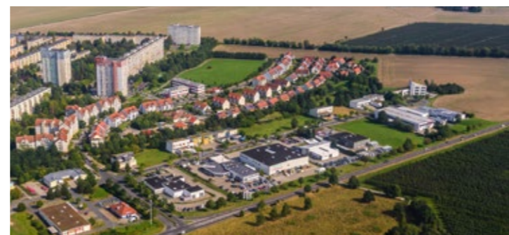
Standort mit Zukunft – Gewerbepark Sonnenstein