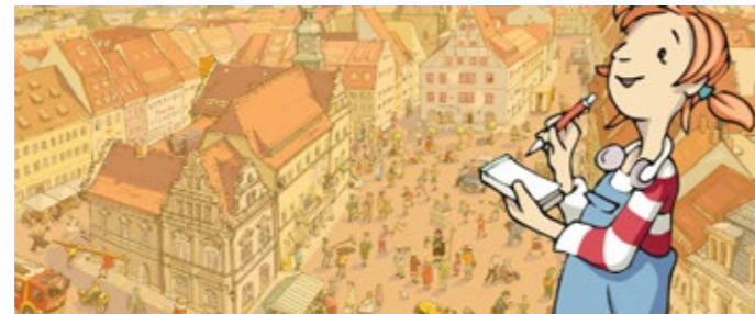
Kinder-Blog „Pines Notiz-Blog“