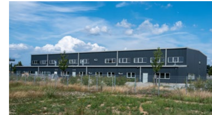
Gewerbehalle Baujahr 2016