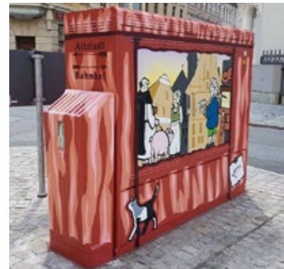
Gestaltung „Telekomkasten“ 2017