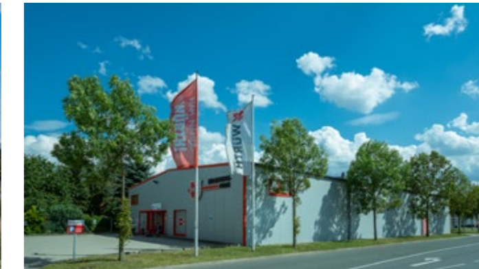
Gewerbehalle Baujahr 2006