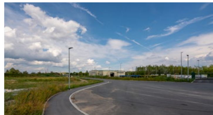
Standort für Unternehmen – Gewerbegebiet Copitz-Nord