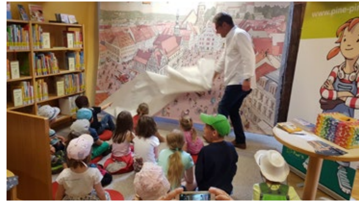
Präsentation „Wimmelbild“ 2019

In Pirna wird seit Jahren ein strategisches und erfolgreiches Stadtmarketing umgesetzt. Der Stadtrat der Stadt Pirna hat durch Beschluss eines Leitbildes den Rahmen für das integrierte Stadtmarketing vorgegeben. Die Service- und Beteiligungsgesellschaft Pirna mbH hat die Gesamtverantwortung für die Umsetzung des Prozesses. Dabei hat sie die Stadtentwicklungsgesellschaft Pirna mbH beauftragt, als Dienstleister diese Aufgabe zu übernehmen. Die Beteiligung von vielen Akteuren spielt jedoch eine wichtige Rolle. Neue Wege gehen und auffallen, das spiegelt sich in vielen Projekten des Stadtmarketing wider.