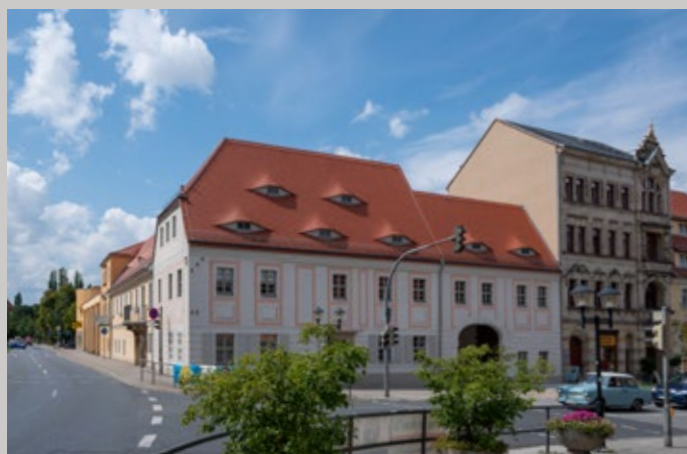
Geschäftssitz Breite Straße 2