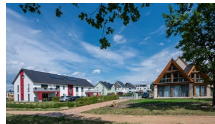
Imposante Entwicklung – Wohngebiet Vogelwiese