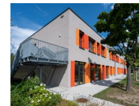
Hortgebäude für 180 Kinder