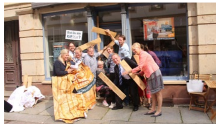
KIP-Star-Kampagne 2018/2019 | „Ab in die Mitte“ 2019, 2. Preis