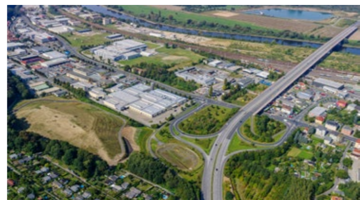
Von Tradition zu Moderne – Industrie- und Gewerbepark ‚An der Elbe‘