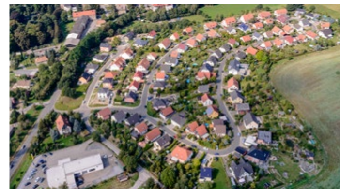
Standort mit Potenzial – Wohnpark Zehista