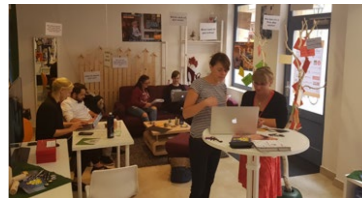
Co-Working mit „Kreatives Sachsen“

Der Fokus liegt auf den Bereichen Einwohner-, Tourismus-, Standort- und Citymarketing. So vielfältig die Herausforderungen sind, so vielfältig sind auch die bisher umgesetzten Maßnahmen, welche ineinandergreifen und zum Erfolg der Stadtentwicklung beitragen. Im Jahr 2019 zählte die SEP mit dem Stadtmarketingprojekt „Pines Notiz-Blog“ zu den drei Finalisten des 25. Dresdner Marketingpreises.