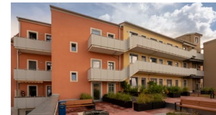
11 Wohnungen und 3 Gewerbeeinheiten in den Wohn- und Geschäftshäusern Breite Straße 4 – 8