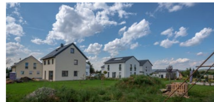
Hervorragende Nachfrage – Wohngebiet Mädelgraben