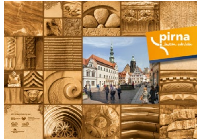
Imagekampagne 2017 „Sandsteinmemory“

Der Fokus liegt auf den Bereichen Einwohner-, Tourismus-, Standort- und Citymarketing. So vielfältig die Herausforderungen sind, so vielfältig sind auch die bisher umgesetzten Maßnahmen, welche ineinandergreifen und zum Erfolg der Stadtentwicklung beitragen. Im Jahr 2019 zählte die SEP mit dem Stadtmarketingprojekt „Pines Notiz-Blog“ zu den drei Finalisten des 25. Dresdner Marketingpreises.